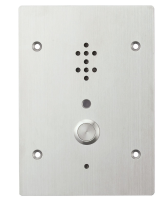
TOA N-8050D Anropsapparat 2-tråd 1500m vid 2x0,8 IP-54

Objektet har mix av 2-tråds anropsapparater / svvarsapparater och IP baserade anropsapparater / svvarsapparater med PoE matning.