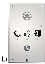
TOA N-8060DS Anropsapparat IP PoE Styrportar 4 ut / 1 in Kan driva extern högtalare IP-54